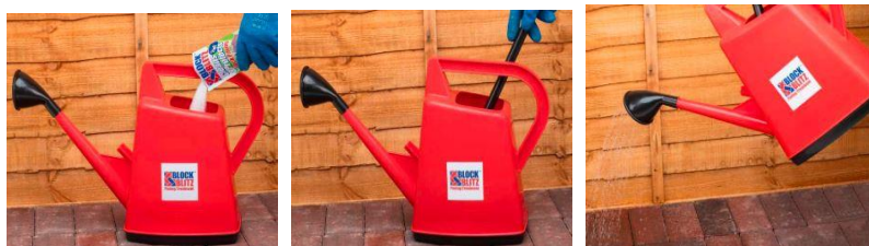
Hæld granulat i vand